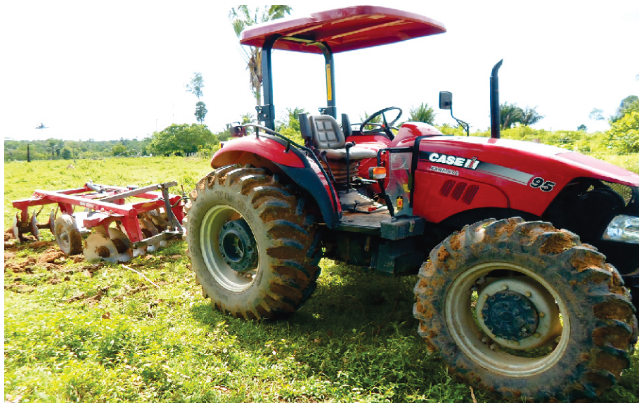
PATRULHA AGRÍCOLA MECANIZADA PARANAÍTA - MT