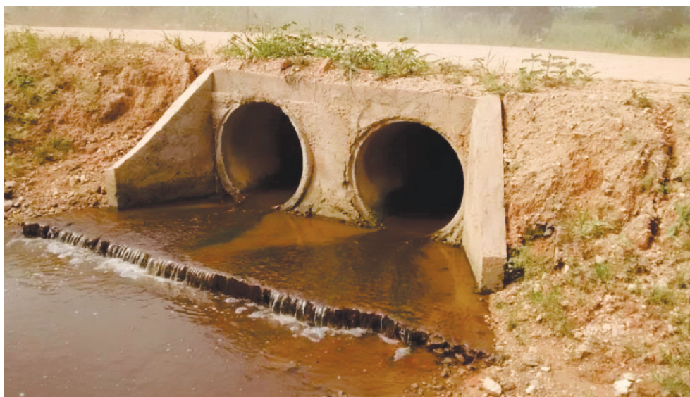
PONTE DE MANILHA E CONCRETO TUCUMÃ-PA