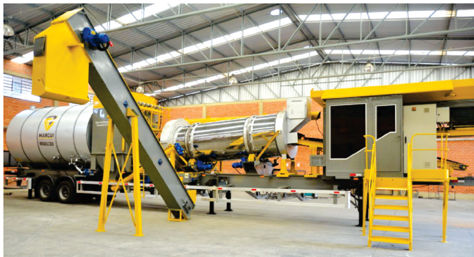
USINA DE ASFALTO SENA MADUREIRA - AC