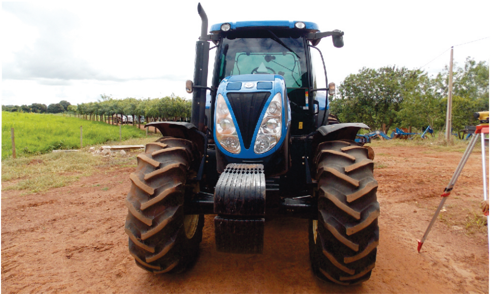
PATRULHA MECANIZADA TANGARÁ DA SERRA - MT