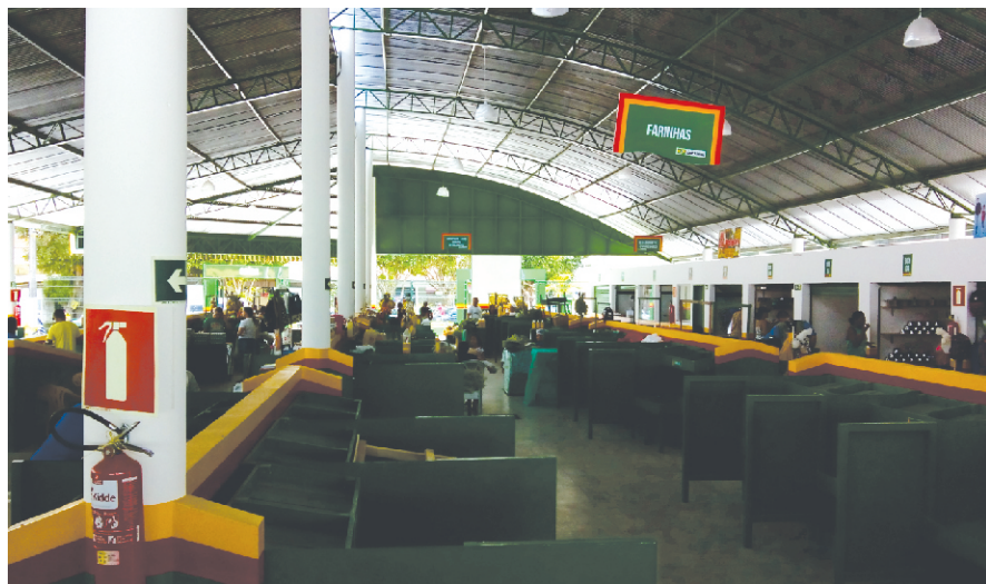
FEIRA COBERTA BARCARENA - PA