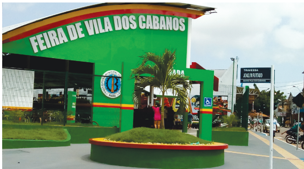
FEIRA COBERTA VILA DOS CABANOS - PA