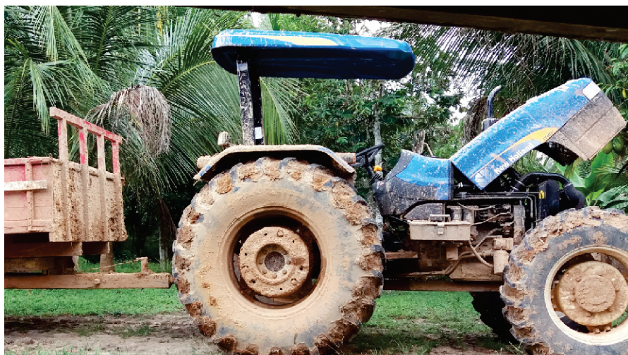
PATRULHA AGRÍCOLA MECANIZADA RODRIGUES ALVES - AC