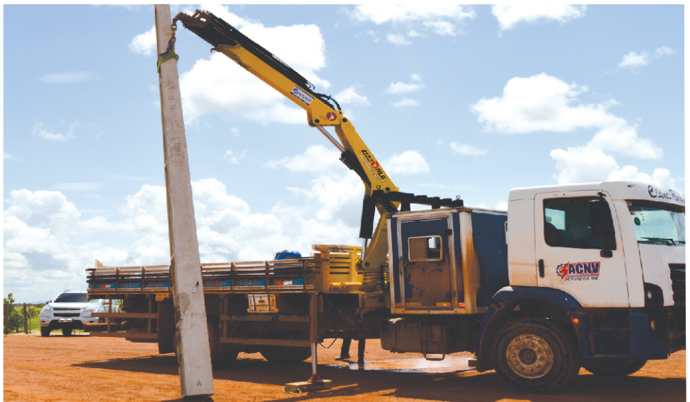
ELETRIFICAÇÃO RURAL BONFIM -RR