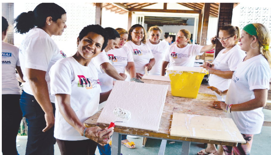
CAPACITAÇÃO MACAPÁ - AP