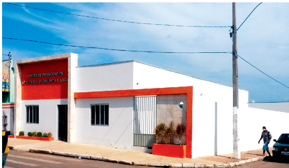
CENTRO DE MÚLTIPLO USO RONDONÓPOLIS - MT